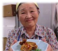
どうぞ 召し上がれ♡