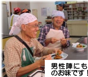
男性陣にも好評 のお味です！