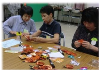
プレゼント制作中