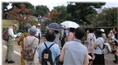
班に分かれて出発です！

10月19日、京都渉成園の自然観察へ。シニア自然大学の方が熱心に解説してくださいました。