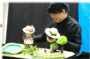
めい遊さんの人形芝居