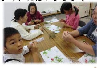
子どもたちも作っています。