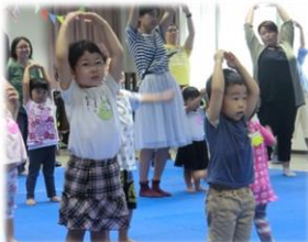
元気よく、ラーメン体操！