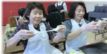
びよ〜んと生地をのばします!