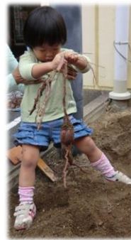
おいもさん出てきたよ☆