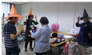
当日の衣装も念入りにチェック!