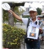
シニア自然 大学の方が 写真も交えて 解説中☆