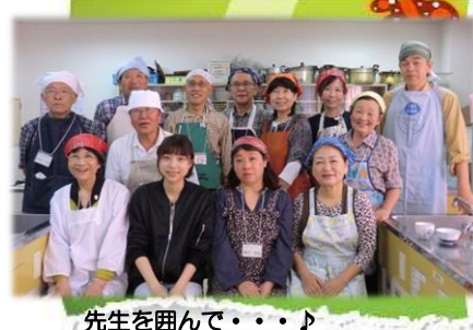
先生を囲んで・・・♪