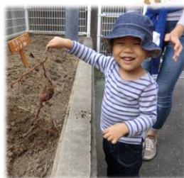
掘れたよ～！うれしい！！