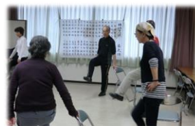
ゆっくり息を整えながら足をあげましょう!