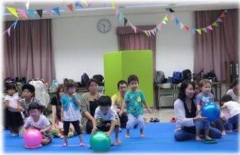
コロコロ～♪コロコロ～♪