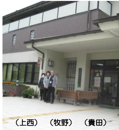
(上西) (牧野) (貴田)