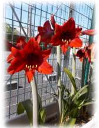
【アマリリスの花】 臨時休館中に見事な花を咲かせました！ 魔よけの赤！です。