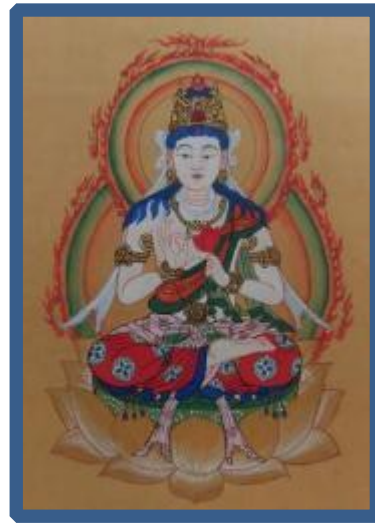
自主グループ「写仏会」作品

当館の自主グループ「リビング体操“小鹿”」講師 日本健康体操連盟 健康体操指導士の方に5回シリーズで指導していただきました。ストレッチのほか、軽快なステップも楽しく学びました。