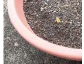
かわいい芽を出したチューリップ

暖かく穏やかだったお正月から一転して、1 月下旬には寒い日が数日続き冬の寒さを思い出しました。もう間もなくお水取りが始まります。これを過ぎれば、春はすぐにやって来ますね。花々のつぼみが開き、虫たちが動き出す頃には、ひとも心がウキウキと「何か新しいことを始めたい」「何か学んでみたい」と思うのではないのでしょうか。そんな時には新しい出会いを求めてぜひ公民館を訪れてみてください。お待ちしております。