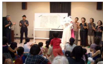
最後は歌って怖さを吹き飛ばそう！ おばけなんてないさ〜♪