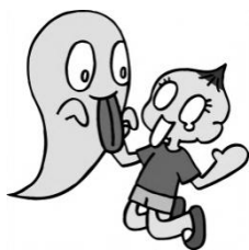
おばけと ゆかいな仲間たち