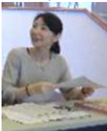
文化祭受付の様子