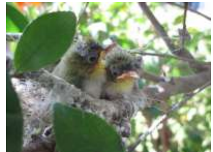
【写真】生涯学習センターの敷地内にて。サザンカにつくられた巣の中にはメジロの雛の姿が… (●^o^●) 微笑ましい光景ですね。

4月初旬より玄関と受付に設置させていただいた、生涯学習センターだよりの「愛称」の募集にご応募いただいた中から選びました。来館される皆様にとって、その日が学習日和となりますように…との思いを込めて、命名いたしました！！