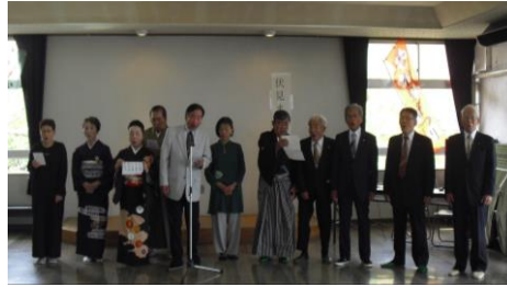
・学風流伏見詩吟同好会