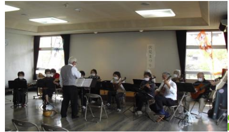
・伏見マンドリンギタークラブ