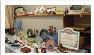
トールペイントバラの会