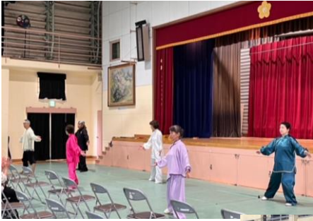
・伏見太極拳教室