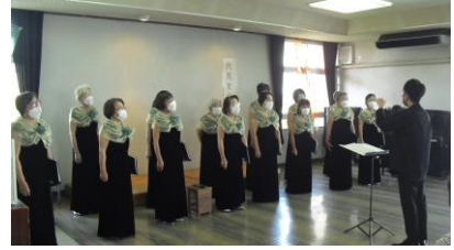
・女声コーラス「プリエール」

公民館会場ではコーラス、詩吟、マンドリンのグループによる発表が行われ、小学校会場ではバンド演奏、太極拳の発表が盛大に行われました。多くの皆さまが観覧に駆けつけてくださいました。ありがとうございました。