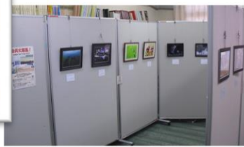
伏見ゆうゆうフォトクラブ