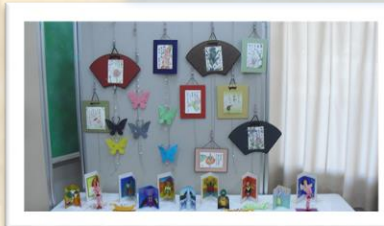
ぼちぼち行こう会