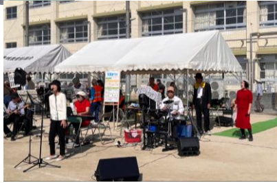
・ナイスブレンド