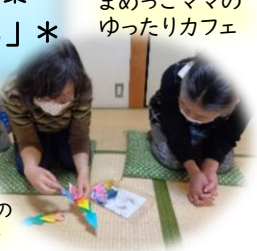
まめっこママのゆったりカフェ