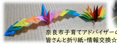
奈良市子育てアドバイザーの皆さんと折り紙・情報交換☆