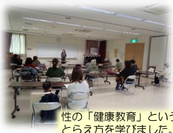
性の「健康教育」というとらえ方を学びました。