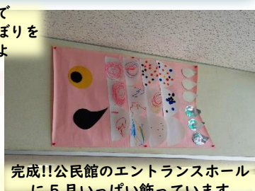
完成!!公民館のエントランスホール に5月いっぱい飾っています