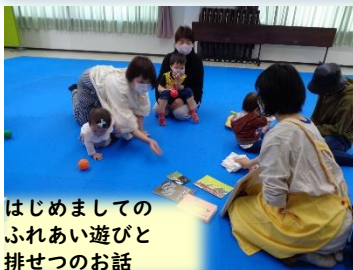
はじめましての ふれあい遊びと 排せつのお話