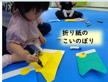
折り紙の こいのぼり