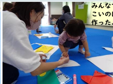
みんな こいのぼりを 作ったよ