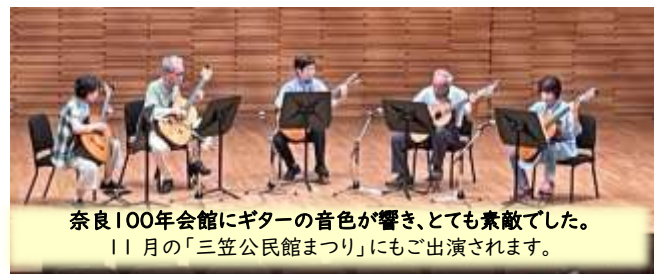
奈良100年会館にギターの音色が響き、とても素敵でした。 11月の「三笠公民館まつり」にもご出演されます。

『大宮まつり』(大宮地区自治協議会・大宮まつり実行委員会 主催)に「エンジョイ・ギター」の皆さんが出演されました！