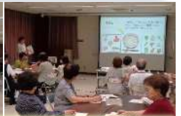
食事の話の聞いたりグループワークで献立を考えたり、簡単な体操をしたりしました。