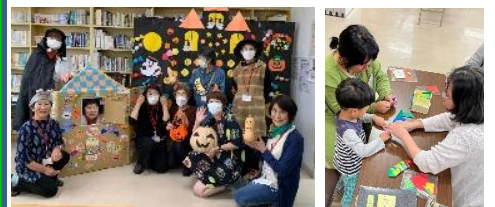
図書ボラ「みなくる」ハロウィン