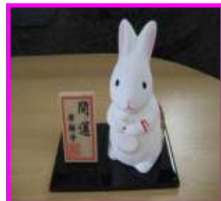
帯解寺さんの卯の置物

そこで南部公民館まつりは、いつも以上に賑やかに開催したいと、ただ今南部公民館自主グループ連絡協議会の皆さんと共に準備を進めております。是非、たくさんのご来場お待ちしております。