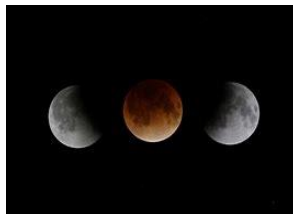
皆既月食の時、月が赤く見えます