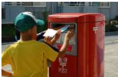
絵手紙をみんなで投函