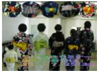
女性セミナー 浴衣の着付け