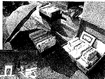
大門玉手箱での古本市の様子です★