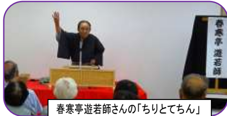
春寒亭遊若師さんの「ちりとてちん」

第2回都跡塾は、7月30日(土)10時から Mr.ミロル パフォーマンスショー 会場は、都跡地域ふれあい会館(小学校前)