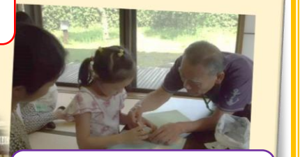
【昔を伝える】 おもちゃ作り、かまど体験