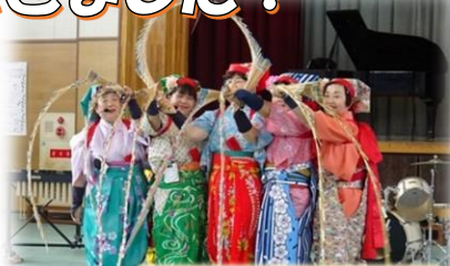
南京玉すだれ都跡教室 (公民館自主グループ)

毎年好例の地域のお祭り。前日が雨だった為、今年は早朝より地域の皆さんがテントを建てるなど準備をしてくださいました。