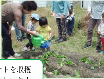
トマトを収穫 美味しいね！