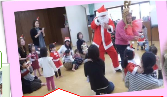
子育てサークルのクリスマス会 サンタさんとトナカイさんになって交流