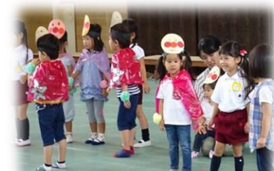
みあとっ子のアンパンマン体操 (子育てサークル「親と子のリズムクラブ」他)

おかげで、今年も沢山の来場で運動場の模擬店も体育館の文化発表も大いに盛り上がりました！子どももおとなも、笑顔いっぱいの日。楽しかったね♪