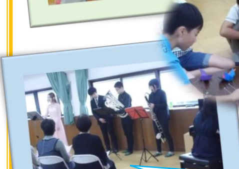
大学生の演奏に、うっとり！ 「みあと女性フォーラム」にて