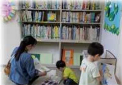
『なかよし文庫』 毎月第3土曜日 10時～15時30分 本の貸出しをしています。