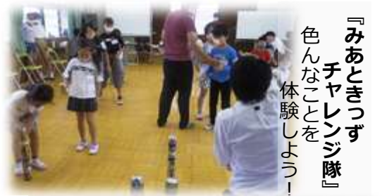
『みあときつず チャレンジ隊』 色んなことを 体験しよう！