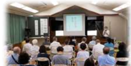
『祈りの物語～興正菩薩叡尊～』 スゴイ人がいたのですね。 奈良のことが、もっと好きになりました！

今回は、6～9月までの講座を写真でご紹介します。是非、今後の参考にしてくださいネ！