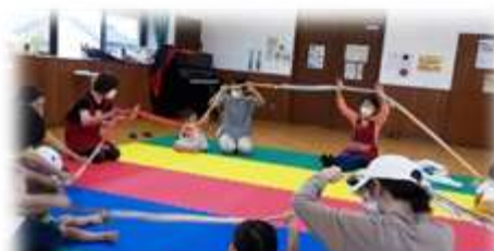
『みあと子育てサロン』 原則毎月第3水曜と最終火曜 10時～12時 楽しいね！