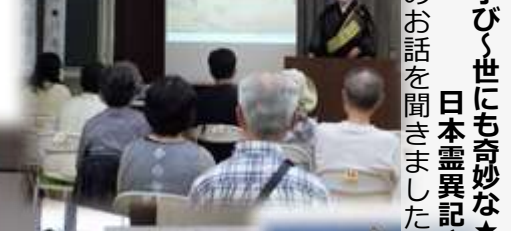
『夜の学びく世にも奇妙な★ 日本霊異記』 地獄のお話を聞きました。