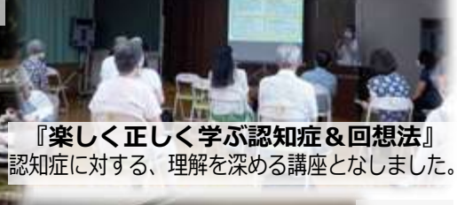
『楽しく正しく学ぶ認知症&回想法』 認知症に対する、理解を深める講座となりました。