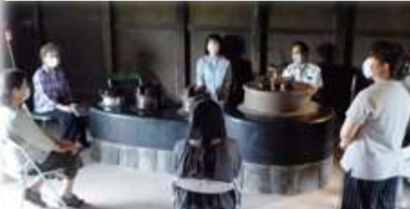
『回想法ボランティア学習会』 『回想法おしゃべりサロン』の実施に 向けて相談中！