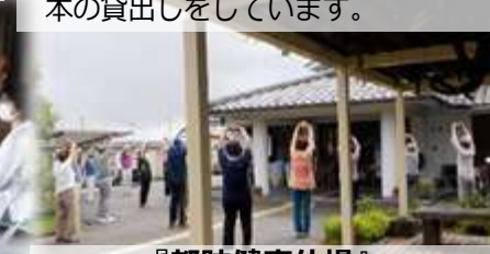
『都跡健康体操』 第3土曜日 10時15分～60分 この日は、3密を避けて室外で実施。