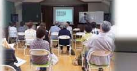
『みあと高齢者学級』↑ 『みあと女性フォーラム』→ 「笑いの健康効果」や「特殊詐欺について」を学習しました。