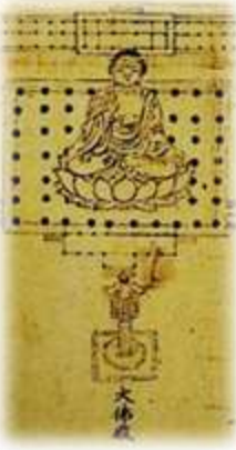
【露座の大仏】 寺中寺外惣絵図 （部分）（「別冊 太陽」日本のこ ろ172より）

ふるさと「都跡」を語ろう会 活動は、原則毎月第1火曜午後から http://miato.seesaa.net/