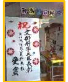
自主グループ連絡協議会で、お祝いの看板を作ってくださいました。

回想法と言えば、高齢者施設等で行われることが多いのですが、社会教育施設である公民館がボランティアの養成を行い、地域の高齢者を対象に回想法を行っているのが「公民館回想法」です。また自主グループ連絡協議会の後押しもあり、音楽サロンなど様々な場面でちょっとした回想法も行われるようになりました。公民館での語らいが仲間意識や生きがいを生み、時にはカウンセリングの役目を果たすようになる等、公民館全体の雰囲気明るく前向きで活発になっているところが「公民館回想法」の魅力の一つです。昨年度からは、都跡地区の社会福祉協議会や包括支援センターなど福祉分野との連携で、回想法を体験していただける機会もできてきました。隣接の古民家を活用して、昔の暮らしを体験する講座では、大人と子どもとの世代間交流も始まっています。