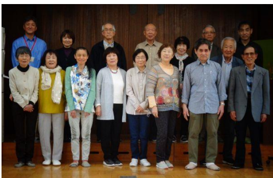
令和8年度の連絡協議会の役員のみなさん

会員の高齢化等により5人以下での活動となつた場合は公民館に相談する。公民館だよりには会員募集の記事を掲載してもらえたり共催事業をおこなう等のサポートが受けられる。