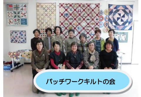
パッチワークキルトの会