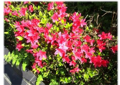
【写真】生涯学習センターの敷地内にて色鮮やかな、クリスマスツツジが咲いています。少し、立ち止まって見てください(#^_^#)

「がくしゅう日和」も3年目に突入しました。がくしゅう日和に、掲載してほしい記事内容がありましたら、お気軽に、生涯学習センター窓口までお問い合わせください。お待ちしております(*^_^*)