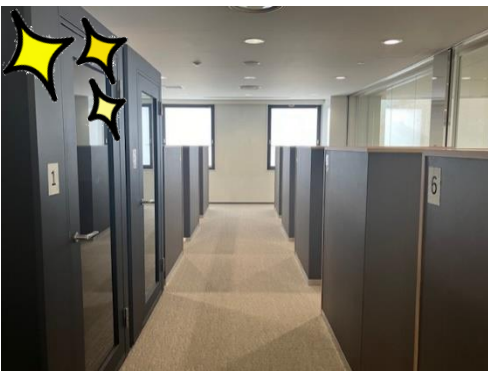
2階 コワーキングスペース