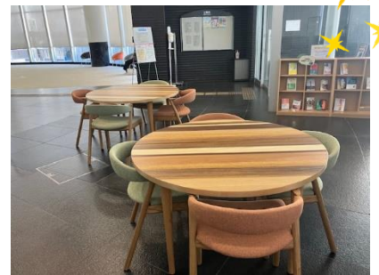
1階 エントランスロビー