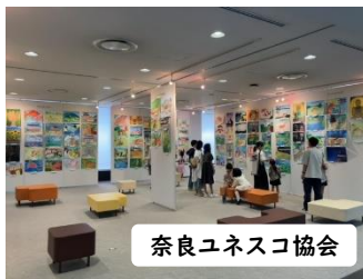
奈良ユネスコ協会

毎年、九月～十一月にかけては予約が埋まることも多いのですが、春先や冬は空いていることが多いです。