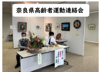
奈良県高齢者運動連絡会