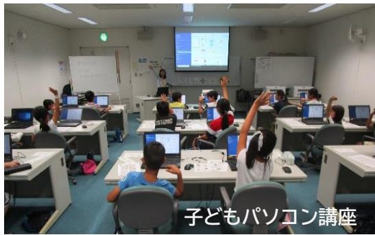
子どもパソコン講座

今回ご案内するのは、当館二階にある「パソコン学習室」。この部屋は一般向けの貸室ではなく、生涯学習センターが主催するパソコン講座専用の部屋です。部屋には、25台のノートパソコンと2台のプリンターを備えています。