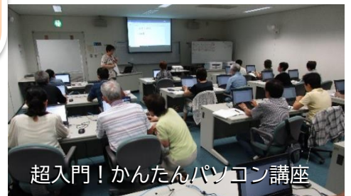
超入門！かんたんパソコン講座

講座中に何度も手を挙げて、質問を繰り返す受講生が講座の成果物を完成させた時の満足そうな顔や自信が付いた様子を見せられたとき。この様な風景を見るたび、サポーターとして嬉しさを感じています。