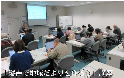
「縦書で地域だよりを作ろう」講座

今年6月には、この「パソコン学習サポーター」を養成する講座を開催し、新規募集を予定しています。興味のある方は、ぜひご応募ください。