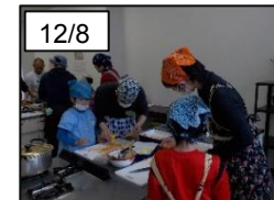
親子でクッキング！