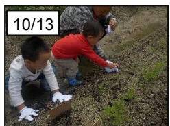
草引きもしました！