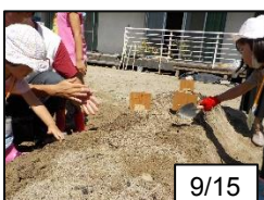
作物を植えました！