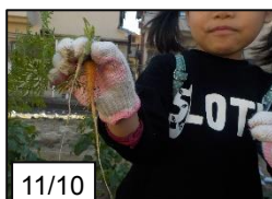
間引いた人参が細い…