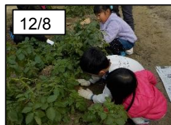
いよいよ収穫します！