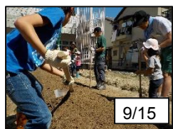
みんなで畝を作って…

家庭支援サポートネットワーク支援事業として、2019年9月から開催していた本講座が、12月8日をもってついに終了となりました。元タグラウンドだった裏庭で、種から育てた作物がちゃんと育ち収穫できるのか心配でしたが、参加者のみなさんが丁寧に世話をしたおかげで、たくさんの作物を収穫することができました！収穫したジャガイモと人参を使って、カレーやポテトサラダ、スープを作ってみなでいただきました！