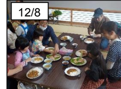
大地の恵みに感謝！

腐葉土や肥料を混ぜるなどして、せっかく耕した土地をたった1年で終わらせるのはもったいない！来年度も、何か裏庭の畑を使った事業を開催するかも！？今後の公民館だよりにご注目ください！