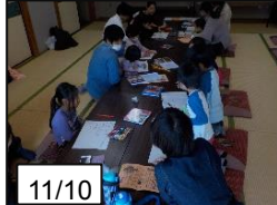
カレーのレシピを検討！