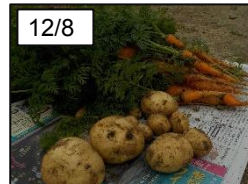
予想以上に豊作でした！