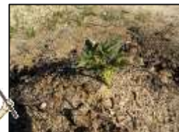
ジャガイモを畝に植え替えてみました！