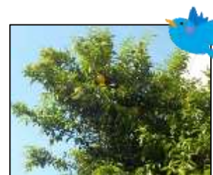
酸っぱいけど、なかなか味わい深いんです！

ところでこのミカン、何の種類がわからないんです。柑橘系に詳しい方、いらっしゃいましたら教えてください！