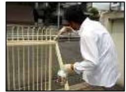
慣れてくると楽しい♪

何とか自分達で出来ないかと職員が調べたところ、錆の上からでも塗れるペンキがあるとの情報をキャッチ。職員の号令一下のもと、目立つ錆を落としてクリーム色のペンキに塗り直しました。素人作業なので塗りムラやタレ跡ができてはしましたが、なかなかの仕上がりに！ご近所の方からも「キレイになったね」と上々の評判です！