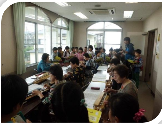
5月11日(水)、六条小3年生が公民館活動を見学。大正琴を初めて見た子もいて、興味津々！

放送大学では平成二八年度第2学期(十月入学)の学生を募集中です。 放送大学はテレビ等、ラジオ、インターネットを通して学ぶ通信制の大学です。 心理学・福祉・経済・歴史・文学・自然科学など、幅広い分野を学べます。 出願期間について第1回は8月31日まで。第2回は9月20日まで。資料を無料で差し上げます。お気軽に放送大学奈良学習センター(〇七四二・二〇・七八七〇)までご請求ください。 放送大学ホームページでも出願できます。