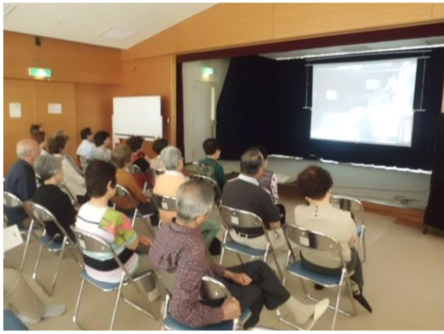
【京西公民館では、校区内で映画会のできる集会所をさがしています。情報をおまちしております。】

☆次回公民館だより発行は9月の予定です。11月は公民館まつりを開催。ただいま企画中☆