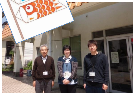
京西公民館の職員です。今年度もよろしくおねがいします。

「こいのぼり、やぶれてるよ・・・！」 京西公民館では、毎年5月にこいのぼりを旗のポールに泳がせてきましたが、今回ついに破れてしまい、来館者の方から言われて、見上げてみてショック…。そこで、お家で何年も飾っていないこいのぼりで状態の良いものがありましたら、公民館へお持ちいただけませんか。保育園の子たちも楽しみにしてくれているので、来年の5月もぜひ飾りたいと思います。ご協力をおねがいします。