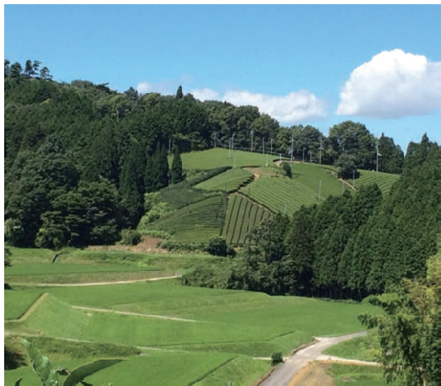
夏の田原、緑がきれいで素晴らしい景色です