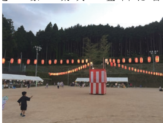
盆踊り、今年も晴れるといいですね！

その二日 後の13日には今年も田原地区の盆踊りですね。大きな花火が今年も楽しめです。今年も田原公民館と一緒に出店をしますよ。前後しますが5日には東部5地区公民館合同主催の、小学生対象デイキャンプがあります。去年、田原で行われましたが協力隊もお手伝いさせてもらいました。今年も柳生。もちろん協力隊は今年もスタッフです。今年も奈良市東部の5人だけではなく、都祁と月ヶ瀬の協力隊も。同じ市内の協力隊といえども集まる機会はなかなかないので、今から楽しみです。