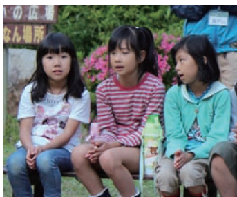
ゲームで盛り上がりました