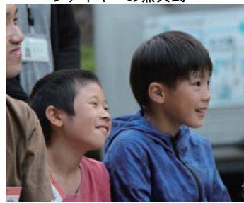
自然と笑顔がこぼれます