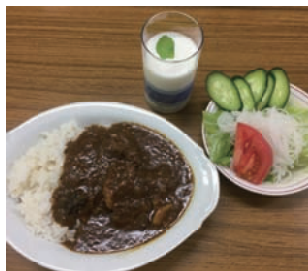
完成したカレー、サラダ、ラッシャー