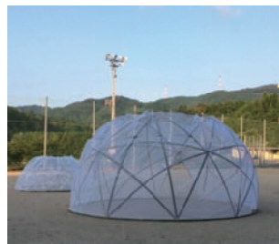
今年も一緒にどうぞ