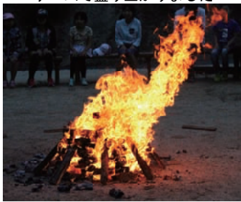
キャンプファイヤーでしめくり