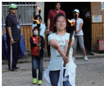
ファイヤーの点火式

田原・柳生・興東・月ヶ瀬・都祁の各地区の公民館が共催し、それぞれの地域の小学生を対象に毎年実施しているデイキャンプ。5年かけて一巡し、二巡目の初回となった今年。去年の猛暑の中、実施した反省から、夏休みを避けて梅雨入り前の6月3日(土)に「クリエート月ヶ瀬」にてキャンプを行いました。自己紹介カードで名刺交換したあと、交流ゲームで盛り上がり、仲良くなった友だちと野外炊事。野菜を切って、お米を洗って、薪に火をつけて。2年生から6年生まで普段顔を合わせることもない他地区の子どもたち同士が協力して進めていきます。初夏の風に吹かれて美味しいカレーライスをいただいた後は、お待ちかねのキャンプファイヤー。トーチ係の6年生の勇姿が始まったプログラムは炎が星の形に燃え尽きるまで続きました。元気いっぱい走り回った子どもたちには学校とは違う仲間と貴重な経験となりました。