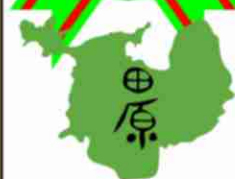
取材：泉森 由貴