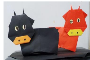
自主グループ 折り紙教室の作品

公民館では、自主グループ活動を始め、様々な学習が行われています。今年は、丑年にちなみ、学習の一步を公民館で踏み出してみませんか。皆様のお越しを、職員一同お待ちしております。本年もどうぞよろしくお願い申し上げます。