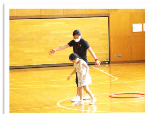
楽しみながら有酸素運動