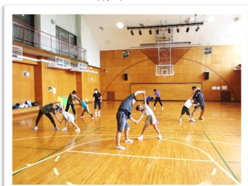
みんなで楽しみます