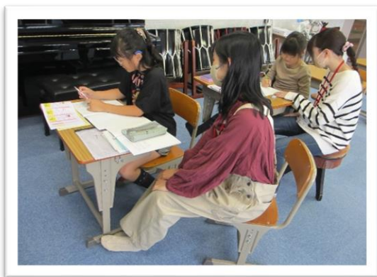
宿題も講師と一緒に

子ども達の自主的な学びの場として学習する機会を提供し週1回程度、大学生の講師を依頼して苦手な科目を克服しています。学習終了後には様々な遊びやスポーツを「自由」に楽しんでいます。