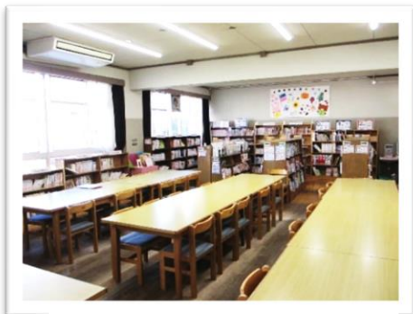
会場 大宮小学校図書室

大宮校区子ども育成連絡会は、大宮小学校校区の子ども達の安全と健全育成を啓発するとともに、各種団体相互の連絡・協調を図る事を目的に毎月開催され、情報の共有をしています。今後も地域の防犯と子ども達の安全のために活動していきたいと思えます。