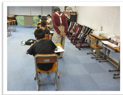
宿題以外の勉強にも取り組みます