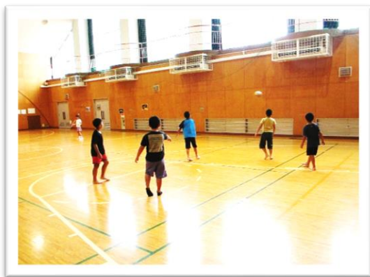
高学年の壁当てドッチボール