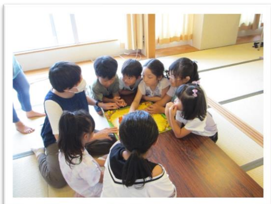
勉強の後はボードゲームの先生と