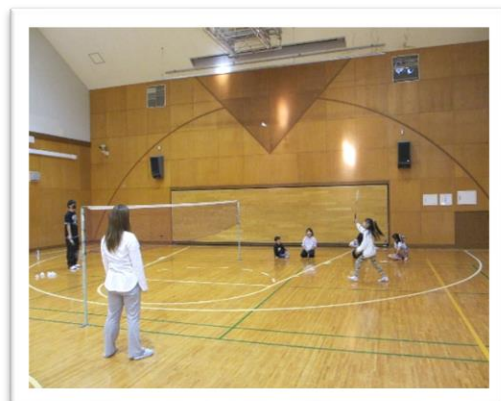
スポーツ学習 大学生とバドミントン