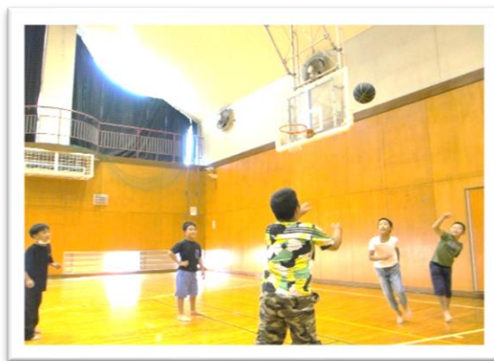
定番のバスケットボール