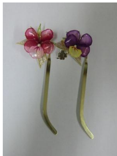
髪飾りやブックマーク