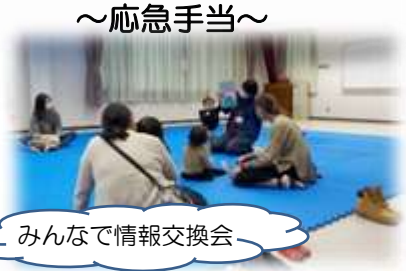
みんなで情報交換会