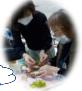
みんなでかわいらしいリースを作りました☆