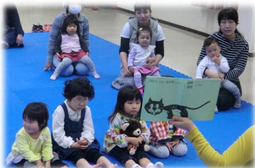
みんな、お話の世界へはいりこんでいます☆

4月22日、こいのぼりを作りました。とってもキュートなこいのぼりができあがりました！