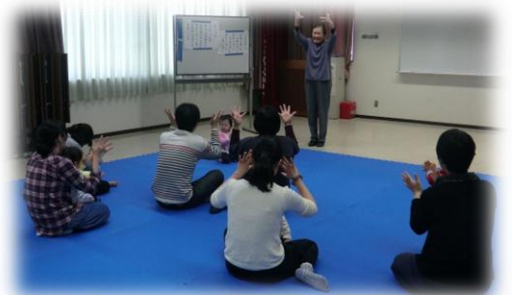
おててをぱっとひろげましょ♪

4月22日、こいのぼりを作りました。とってもキュートなこいのぼりができあがりました！