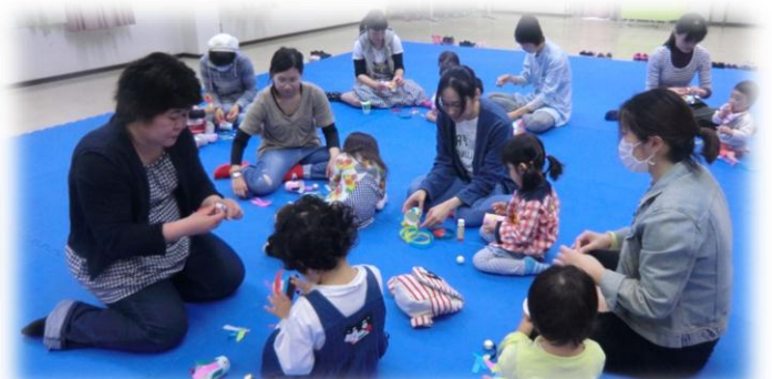
ママと一緒に作業中☆ちいさな手がいそがしく動きます！