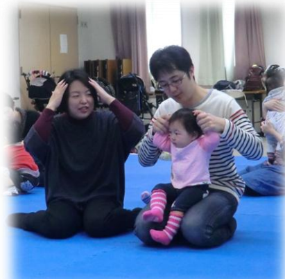
パパとママと私とっ！一緒にいいよねえ☆