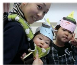
作ったお面、つけてみました☆