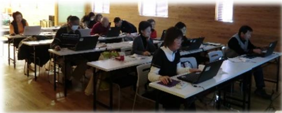
パソコンとにらめっこしながら受講中！

1月28日、社会福祉法人ぷろぼのさんの協力で開催。インターネットを活用しながら旅のしおりづくりをしました。