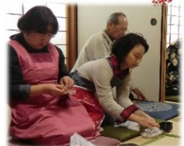
できたてをお抹茶とともにいただきます～！