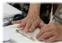
先生のお手元です