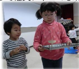
コマまわし、上手でしょ？