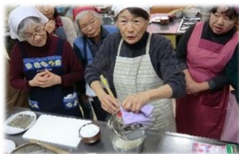
説明しながらも、手際よく手元がすすみます。さすが先生！