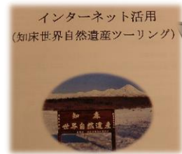
こんなテキストでした☆