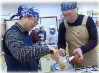
男性コンビで奮闘中！