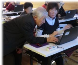
先生が直接指導中です☆