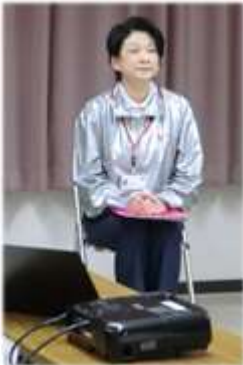
日赤より講師をお招きし、開催 しました☆先生のこの姿勢にこ ちらも背筋がぴんとしました。

2月18日読み物による過去の災害の追体験をすることで、その時々に必要なことについて考える時間となりました。