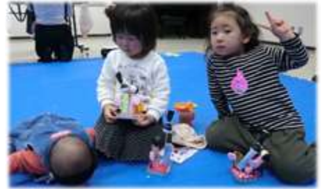
いろいろな角度から自由にお雛さま たちを見つめております♪