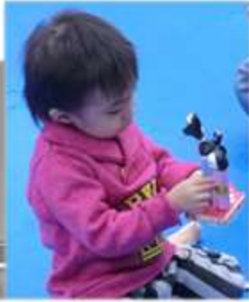
ぼくとママが 作ったんだよ☆ かわいくできて るよねっ！