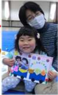
すてきな壁飾りが できましたね～♪