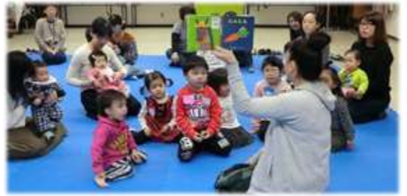
みんな絵本が大～好き♡